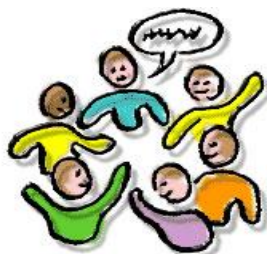
G E S P R E K