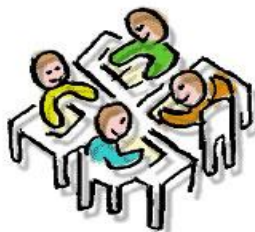
W E R K