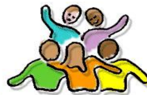
V I E R I N G