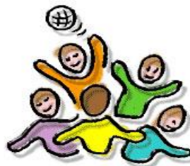
S P E L