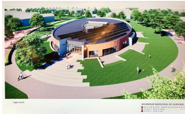
'De Vuurvogel in vogelvlucht'