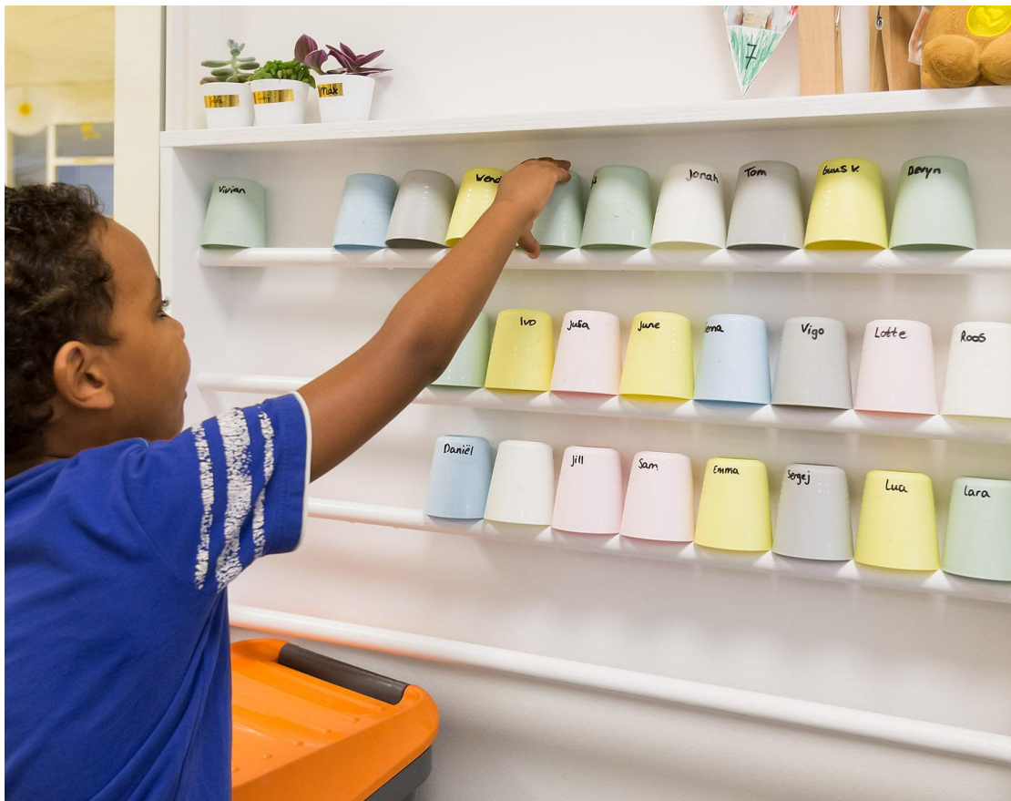
Ieder Kind zijn eigen Beker